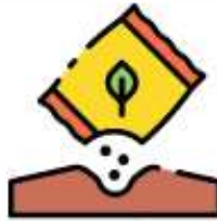
จุลินทรีย์ปรับปรุง บำรุงดิน พต. 1