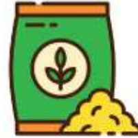
แกลบ 50 กิโลกรัม