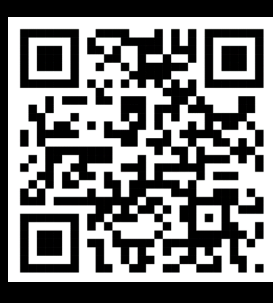
Google sheet ข้อมูลการวัด