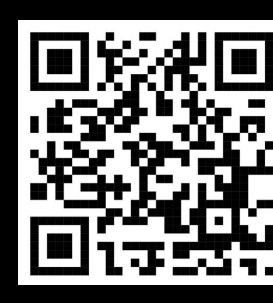
Dashboard ข้อมูลการวัด